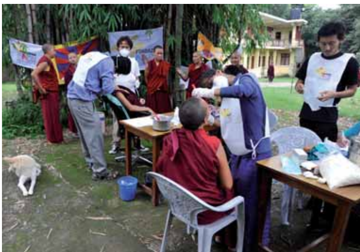
Progetto Ladakh. Campo di lavoro al monastero.