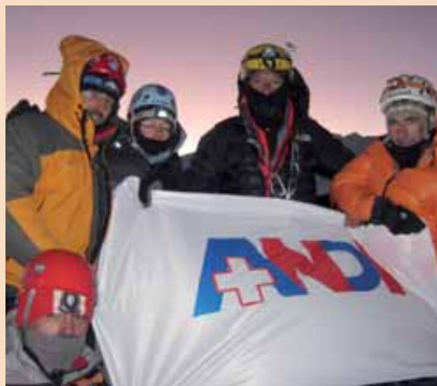
Veruggio con la bandiera dell'ANDI in vetta all'Alpamayo, 5970 mt.!!

... "NON SOLO DENTI" è il mio motto, per dire che non si vive solo pensando al nostro lavoro. Ma porto sempre il nostro bellissimo lavoro e la nostra Associazione, con me nelle salite! Ho iniziato tardi, a 48 anni, ad andare in montagna, e non ero sicuro di tenere il passo dei miei compagni più giovani... All'inizio il Cervino, poi il M. Bianco e il M. Rosa, poi la prima spedizione in Caucaso, l'Elbrus, 5600 mt., a superare la soglia psicologica dei 5000mt. Questo Gennaio 2011, per festeggiare i miei 55 anni, abbiamo salito l' Aconcagua (6962 mt.), la montagna più alta del Sud America e la seconda al mondo "NonHimalaya" ma purtroppo la bandiera dell'ANDI era nella sacca da spedizione che mi avevano smarrito... Appena ritornati in Italia - carichi di entusiasmo! - abbiamo deciso di spendere le nostre va-