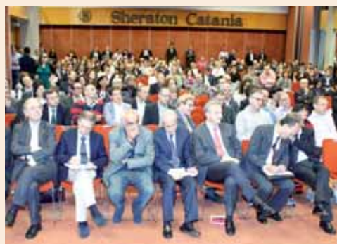
I partecipanti al Congresso.

Grande successo e partecipazione, oltre 450 iscritti, al Convegno Regionale ANDI della Sicilia, tenutosi a Catania il 21 e 22 ottobre 2011.